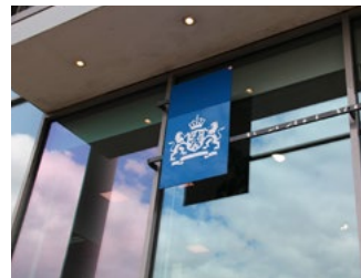
7 Varia arbeidsrecht en sociaal zekerheidsrecht